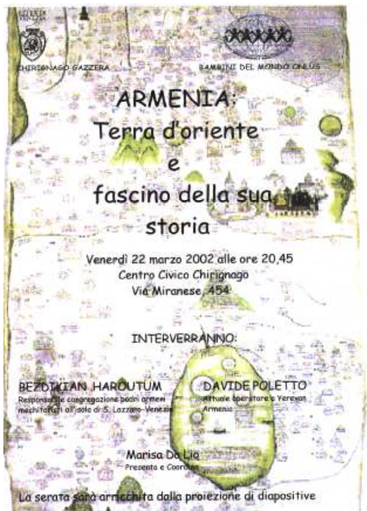
Locandina della serata