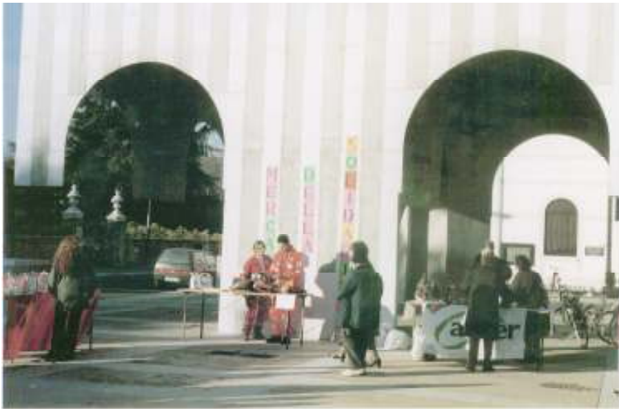
Mercatini di Solidarietà Chirignago