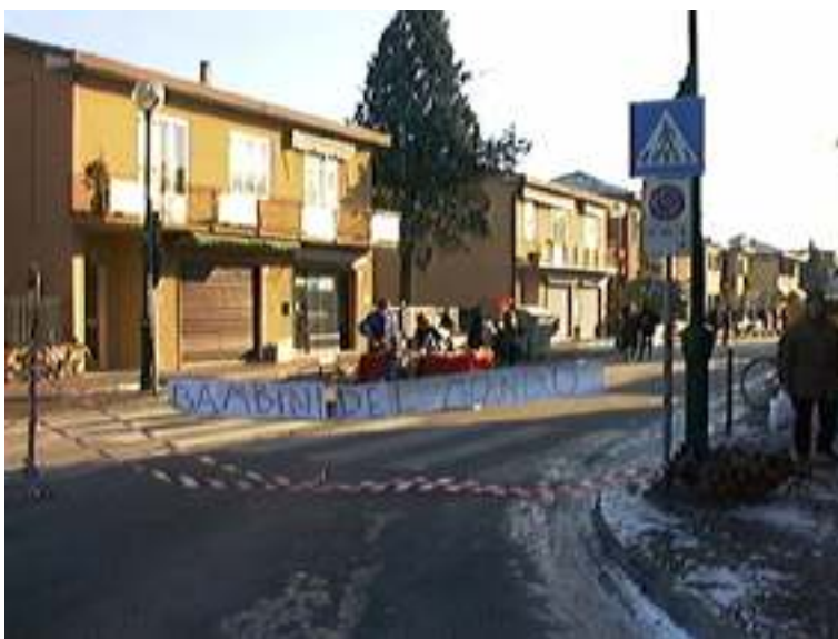
Mercatini della Solidarietà Gazzera