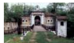
Il Forte Carpenedo